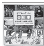
『子どものための美術史 ：世界の偉大な絵画と彫刻』 ヘザー・アレブザンダー・文 メレディス・ハミルトン・絵 千足 伸行・監訳 西村書店